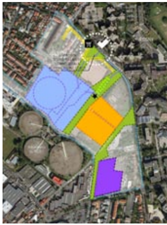
9 - Zone commerciale renforcée sur le Bd de la Boissière