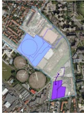
2 - Ecopole