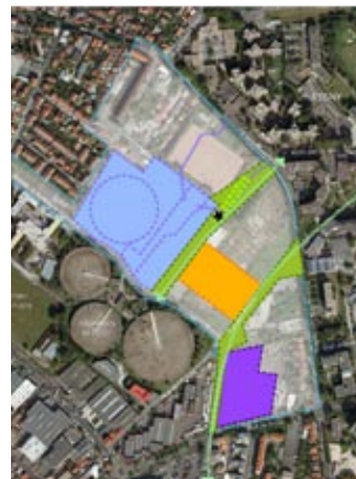
7 - Des espaces publics fondateurs et singuliers