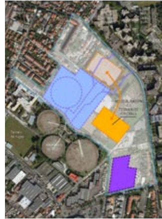
3 - Terrain de foot