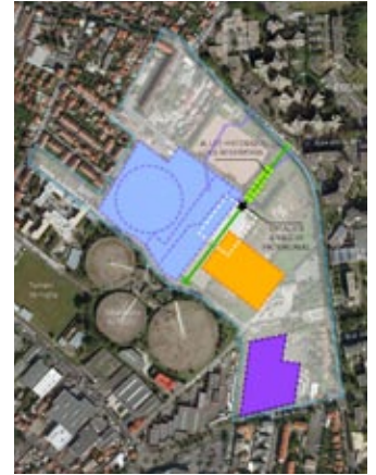
4 - Eléments patrimoniaux