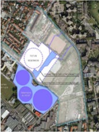
1 - Zone SEDIF