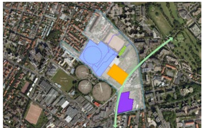
6 - Continuité écologique