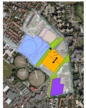
8 - Groupe scolaire - espaces partagés