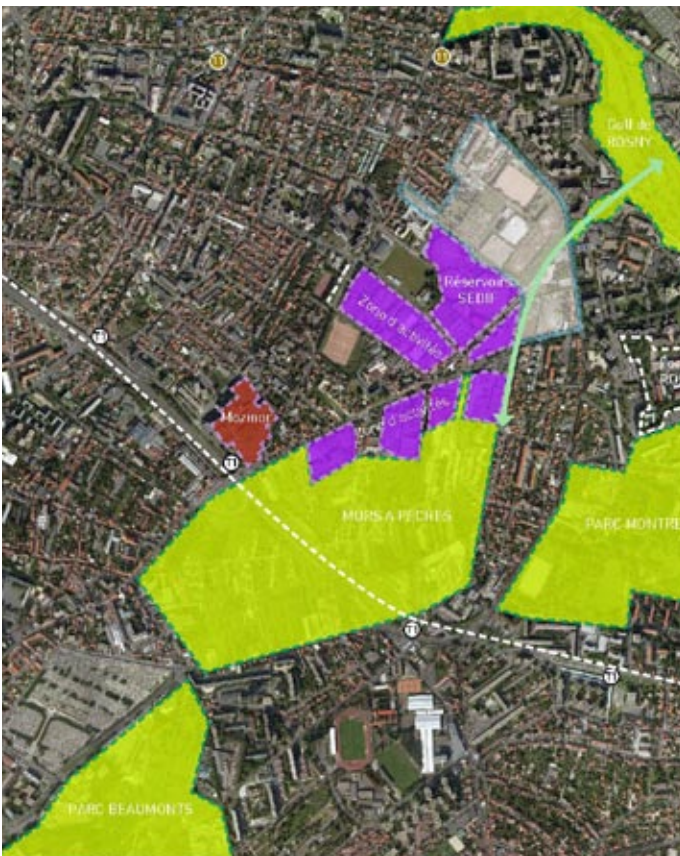
5 - A l'échelle du territoire élargi